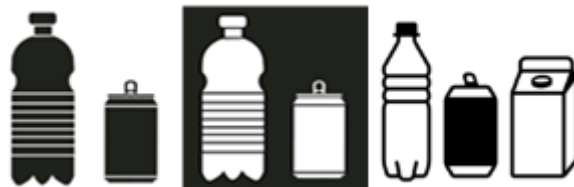
Dit zijn bijvoorbeeld de pictogrammen voor verpakkingsafval

In het kader van het volgende werkprogramma van het CDNI zijn er verschillende initiatieven voorzien om in de binnenvaartsector de aandacht te vestigen op deze richtsnoeren.